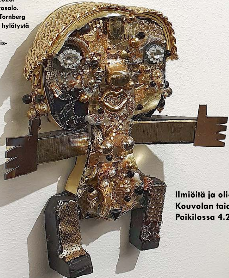
Ilmiöitä ja olioita Kouvolan taidemuseo Poikilossa 4.2.-25.4.