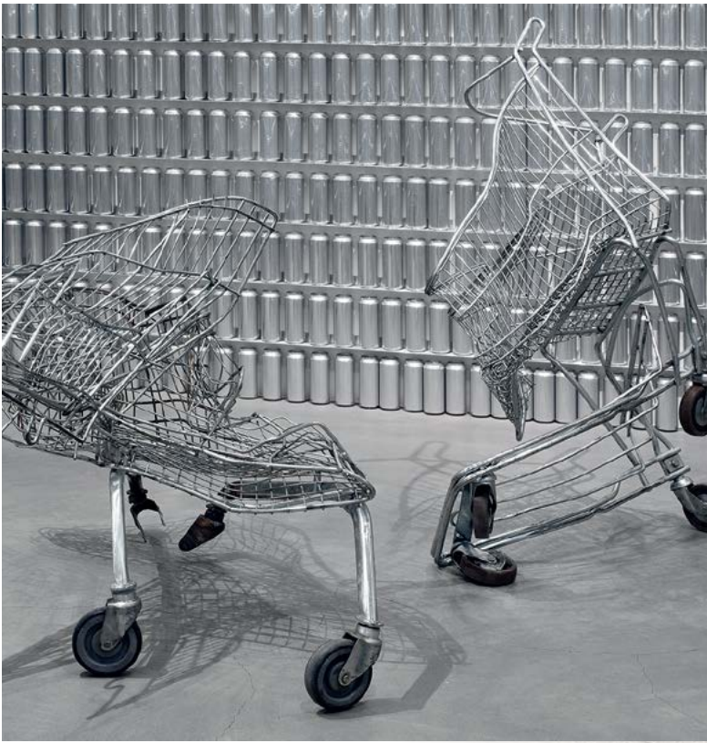
Timo Heino, Addiktio, 2011, vääntyneet ostoskärryt.

TAULUMAINEN TEOS saattaa vaikuttaa maalaukselta, mutta lähemmin tarkasteltuna materiaaleiksi voivat paljastua huonepöly, hiukset tai ampiaispesät.