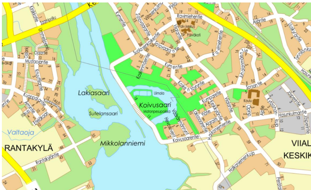
Karttakuva Koivusaaren uimarannan alueesta