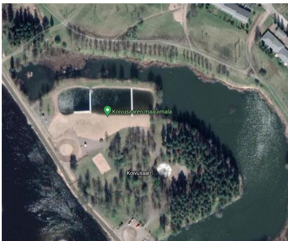
Satelliittikuva Koivusaaren uimarannan alueesta