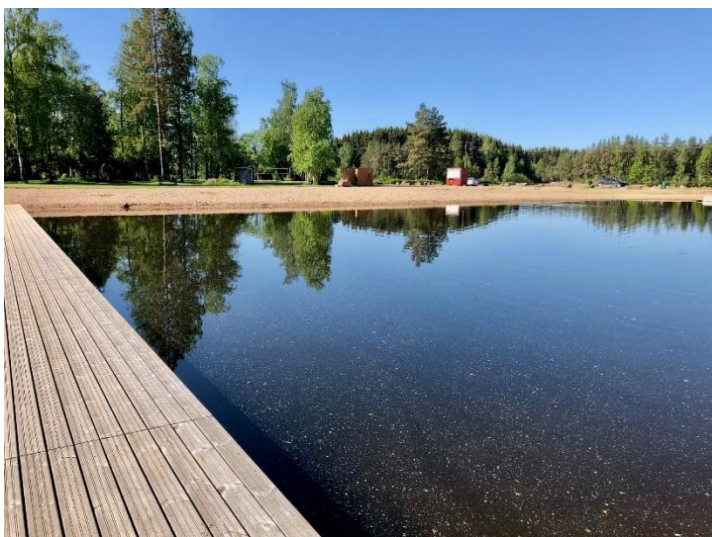
Laiturilta rantaan päin