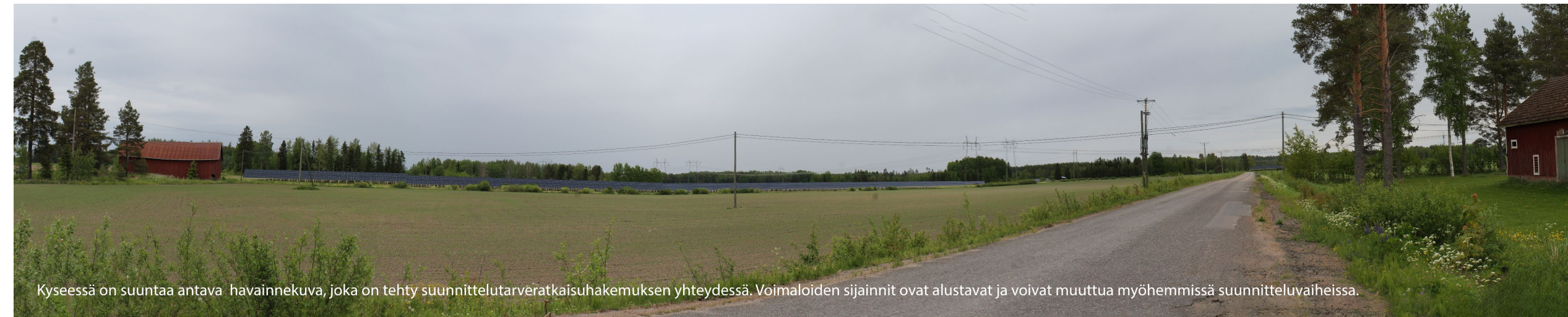
Kyseessä on suuntaa antava havainnekuva, joka on tehty suunnittelutarveratkaisuhakemuksen yhteydessä. Voimaloiden sijainnit ovat alustavat ja voivat muuttua myöhemmissä suunnitteluvaiheissa.