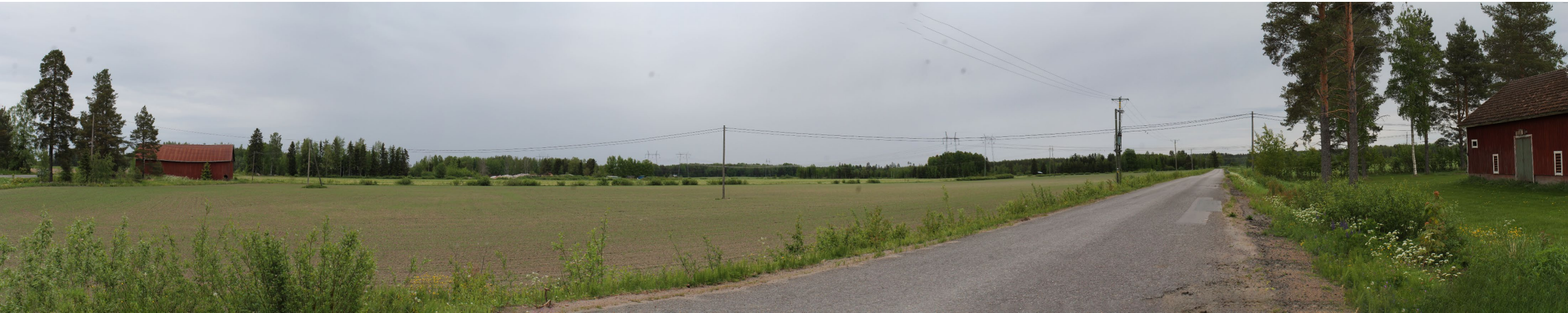
Takamaantie pohjoinen. Nykytila.