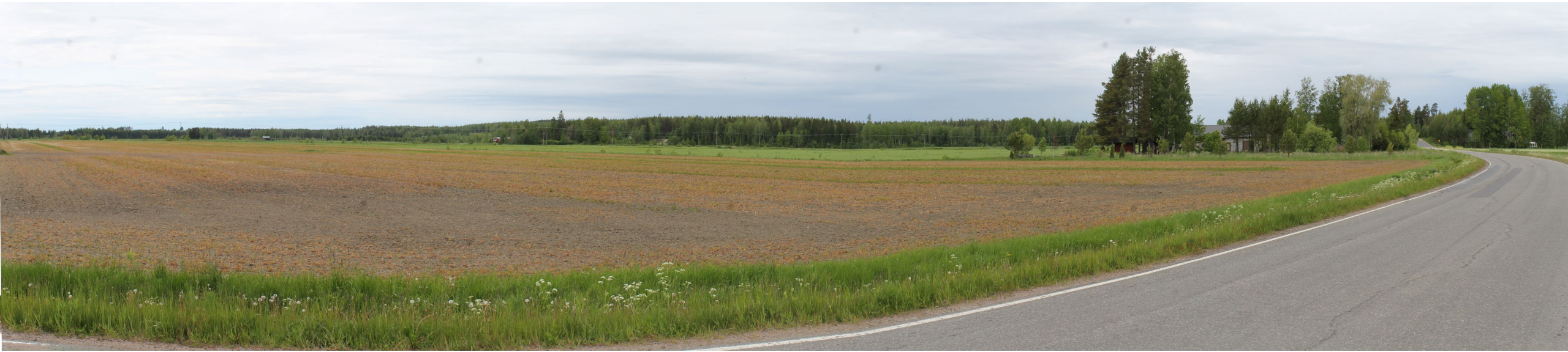
Takamaantie keskiosa. Nykytila.