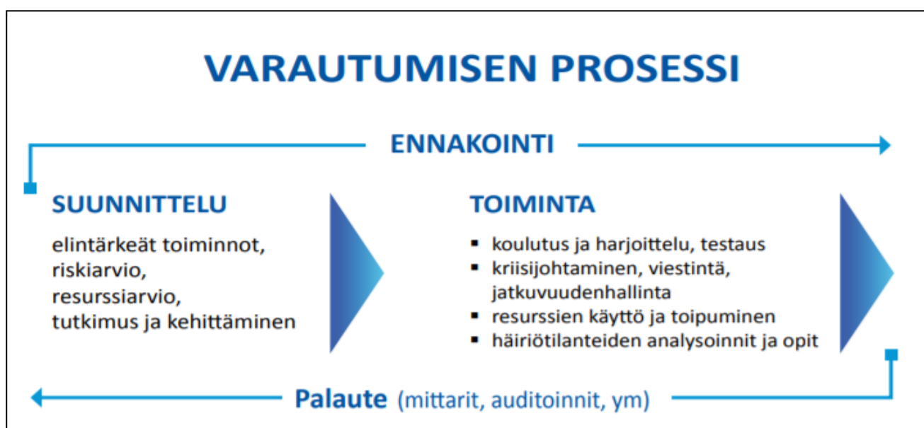
Kuva 1 Varautuminen on jatkuva prosessi, johon kuuluvat suunnittelu ja toiminta. Harjoituksista tai todellisista tilanteista saadun palautteen kautta voidaan suunnitelmia kehittää edelleen.

Kriisiviestintää harjoitellaan osana kaupunkikonsernin valmiuden ja varautumisen harjoittelua. Toimialoilla ja tytäryhtiöissä järjestettäviin varautumis- ja valmiusharjoituksiin sisällytetään kriisiviestinnän harjoittelu.